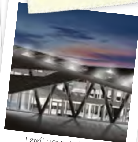
I april 2010 stod det nye hovedkontor færdigt på Havnegade 21 i Middelfart

Great Place To Work kårede Middelfart Sparekasse som Danmarks bedste arbejdsplads for første gang. Siden er det blevet til flere andre priser og nomineringer. Se side 59