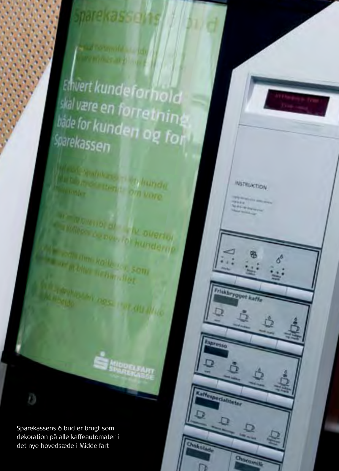
Sparekassens 6 bud er brugt som dekoration på alle kaffeautomater i det nye hovedsæde i Middelfart