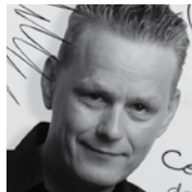
Martin Lindstrøm, international brandingekspert

Hvad sker der reelt i vores hjer- ner, når vi støder på reklamer og brands? Hvorfor køber vi? Og hvad er det dybest set, der påvirker vores beslutnin- ger? En af verdens mest respekterede mar- ketingguruer, forfatter Martin Lindstrøm, fører os ind bag hjernen for at afdække, hvad der påvirker vores køb. Mange købsbeslutninger foregår så langt nede i underbevidstheden, at vi knap nok bemærker dem. Hør de banebry- dende resultater fra en mand, der startede sit eget reklamebureau, da han var 12 og i dag rejser verden tynd for at rådgive topledere hos de førende på det globale marked: McDonalds, Proctor & Gamble, Nestlé, Microsoft og Walt Disney. Martin Lindstrøm er forfatter til Buy•ology og til BRANDsense, der er udnævnt til at være blandt de fem bedste marketing- bøger nogensinde.