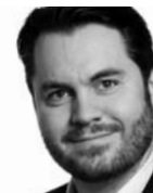
Morten Bay forfatter